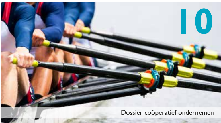
Dossier coöperatief ondernemen