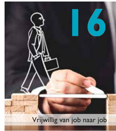
Vrijwillig van job naar job